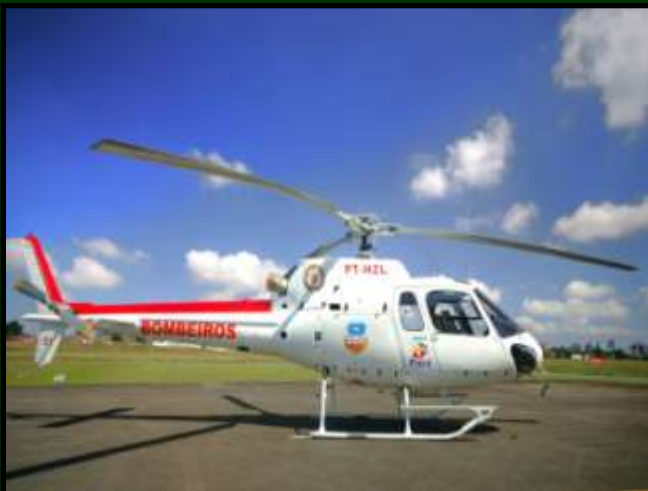
AS 350 BA