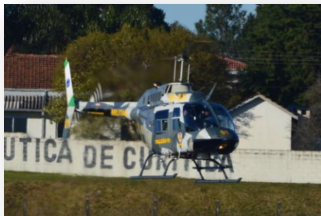
BELL JET RANGER – BH06 FALCÃO 01 – PP-EJI