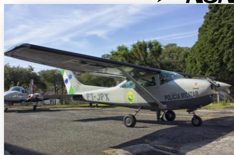
C182 - SKYLANE FALCÃO 05 – PT-JPX