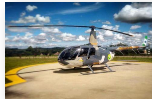
ROBINSON 44 FALCÃO 07 – PP-ADN