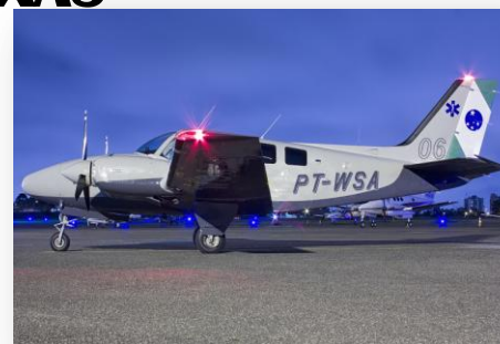
BE58 - BARON FALCÃO 06 – PT-WSA