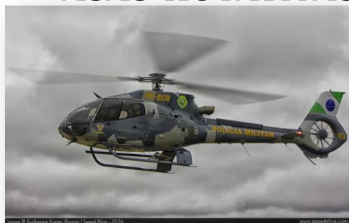
EC130 - B4 FALCÃO 03 – PR-ECB FALCÃO 04 – PR-BOP